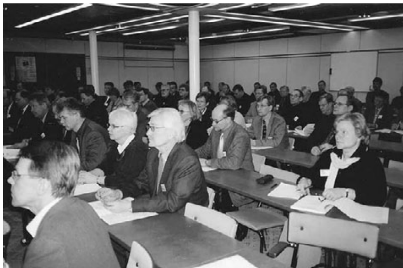
Neuvottelupäivämme Silja Serenadella Palopäällystöliiton kanssa 2002