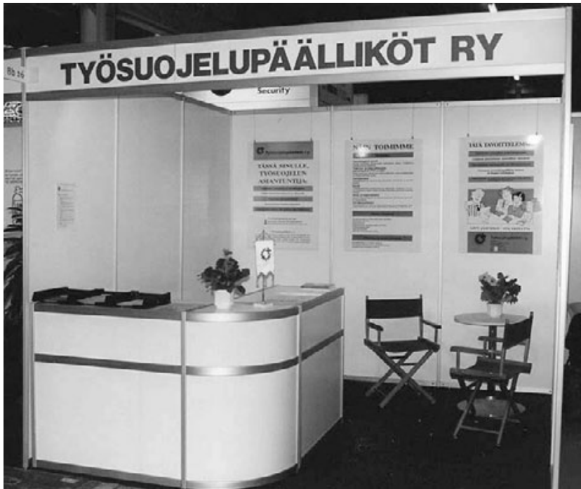
Yhdistyksen standi sekä Turva- että Finnsec-messuilla

TTP-päivien 20-vuotisjuhlaseminaari vuonna 1993 sujui turvallisesti valkealla laivalla, mutta omilla neuvottelupäivillämme syksyllä 1994 oltiin sattuman oikusta jo ennakkoon ongelman ytimessä teemalla viestintä turvallisuustyön välineenä eli juuri ennen Estonian uppoamista.