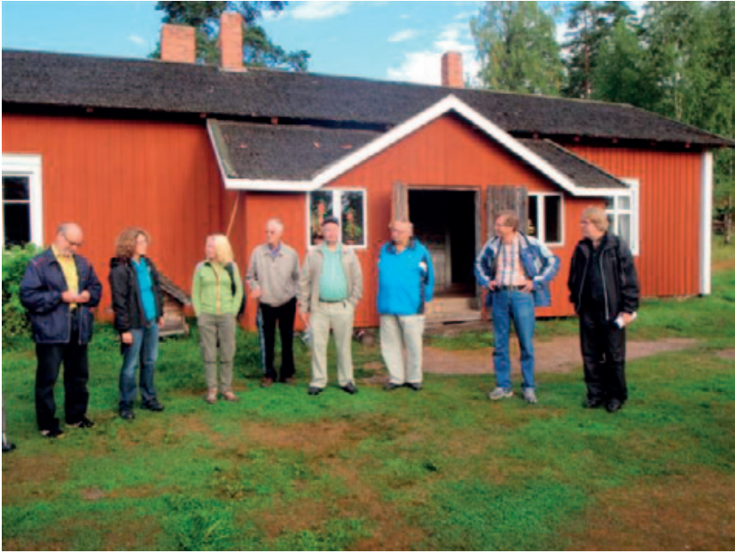
Yhdistyksen jäseniä kesän aluetapaamisessa 25.8.2010 Korteniemen perinnetilalla, Liesjärvellä.