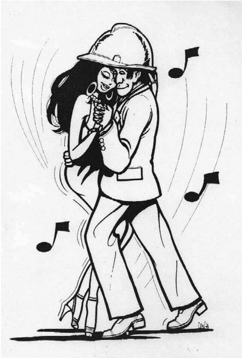
Työsuojeloveljet ja -siskot käsi kädessä joulun alla 1976 – ja tänäänkin neljä neljättä ajastaikaa myöhemmin